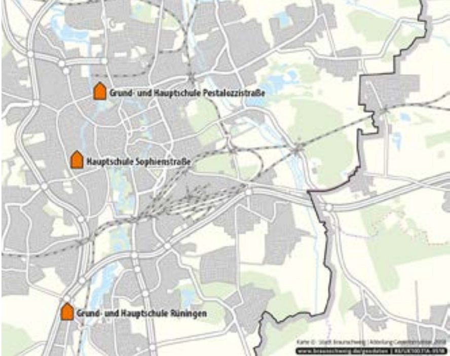
خريطة موضحة للمدارس الأساسية

في المدرسة الأساسية، يدرس التلاميذ التعليم العام الأساسي. ويتم تمكينهم هناك من توجيه أنفسهم مهنيًا. وتم تصميم الدروس لتستند إلى مواقف مشابهة للحياة الحقيقية ومتطلبات العمل.