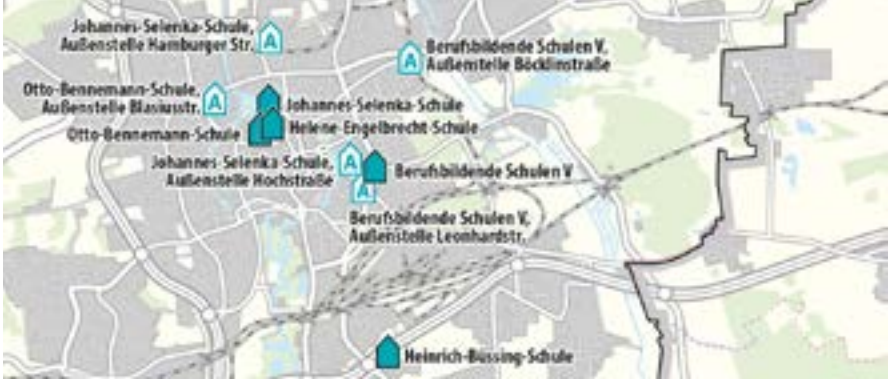
خريطة موضحة لمدارس التعليم المهني

تقدم مدارس التعليم المهني أيضاً برامج دراسية تكميلية، وبالتالي تقدم فرصة للحصول على شهادات دراسية مختلفة بغض النظر عن المؤهل / التدريب المهني. ويتم في هذا القسم تقديم فقط البرامج الدراسية التي لا يشترط للالتحاق بها الحصول على شهادة مهنية سابقة، والتي تُمكن من الحصول على شهادة دراسية (أعلى).