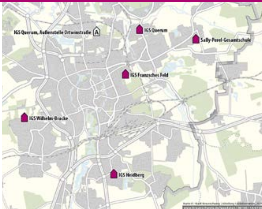
خريطة موضحة للمدارس الشاملة المتكاملة

توفر المدرسة الشاملة المتكاملة كبدل للنظام المدرسي الثلاثي - مثل المدرسة الأساسية، والمدرسة المتوسطة، والمدرسة الثانوية العامة - للتلاميذ أيضًا التعليم العام الأساسي، أو المتقدم، أو المتعمق، وواسع النطاق. ويمكن أيضًا الحصول على المهارات التي تعمل على الإعداد للدراسة الجامعية. وتشمل المدارس الشاملة المتكاملة في براونشفايغ الصفوف من 5 إلى 13 (المرحلة الثانوية الأولى والثانية). ويمكن الحصول على جميع الشهادات الدراسية، من شهادة التعليم الأساسي إلى شهادة الثانوية العامة، وهي متاحة أيضًا في المدارس التكميلية العامة. وليس من الضروري اتخاذ القرار الخاص بالحصول على شهادة دراسية معينة في بداية الصف 5، ولكن يتم ذلك فقط في نهاية المرحلة الثانوية الأولى، ويتوقف على التطور الفردي للتلاميذ وأدائهم. اللغة الأجنبية الإلزامية هي اللغة الإنجليزية. وفي مدارس براونشفايغ الشاملة، يمكن أخذ لغة أجنبية ثانية كمادة اختيارية إلزامية بداية من الصف 7. ونظرًا لأن إجمالي أماكن الدراسة في المدارس الشاملة في براونشفايغ محدود، يتم قبول التلاميذ في الصف 5 من خلال قرعة متميزة. الطلاب والطلبات القادمين من أنماط مدرسية أخرى يمكنهم الالتحاق بالصفوف التالية في إحدى المدارس الشاملة المتكاملة، إذا كانت هناك أماكن متاحة في المدرسة الشاملة المتكاملة.