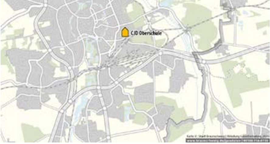
خريطة عامة توضح المدرسة الثانوية

تعتبر المدرسة الثانوية إحدى مدارس المرحلة الثانوية الأولى، وتضم الصفوف من الخامس إلى العاشر. والمدرسة الثانوية قد تكون مدرسة ثانوية بدون إتاحة الحصول لاحقاً على شهادة إتمام الثانوية العامة، أو مدرسة ثانوية تتيح لاحقاً الحصول على شهادة إتمام الثانوية العامة. كما يمكن أن يكون هذا النوع من المدارس بدوام دراسي كامل مفتوح، أو بدوام كلي مرتبط جزئياً، أو بدوام كلي مرتبط كلياً.