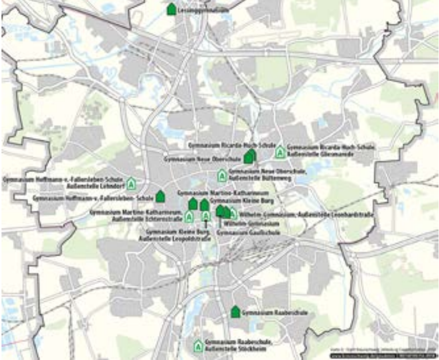
خريطة موضحة للمدارس الثانوية العامة

تقدم المدرسة الثانوية العامة تعليمًا عامًا واسعًا ومتعمقًا. ويمكنهم الحصول على المهارات التي تجعلهم مستعدين للدراسة الجامعية والتدريب المهني. وتنقسم الثانوية العامة إلى المرحلة الثانوية الأولى والمرحلة الثانوية الثانية (المرحلة الثانوية العليا).