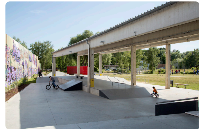
Jugendplatz am Westbahnhof

An der Ausbauplanung und Realisierung weiterer Ringgleisabschnitte wird aktuell intensiv gearbeitet. Das westliche Ringgleis verbindet bereits verschiedene kulturelle Einrichtungen, Schulen, Nahversorger, Wohnen und Arbeit und hat die infrastrukturellen Entwicklungen in diesem Bereich weiter begünstigt. Verschiedene Freizeitangebote wurden direkt am Ringgleis realisiert, wie zum Beispiel der Spielplatz Gartenkamp, der Jugendplatz Werksteig, der Jugend- und Skatepark am Westbahnhof, der Mehrgenerationenpark, der Garten ohne Grenzen sowie die denkmalgeschützte Grünanlage Jödebrunnen.