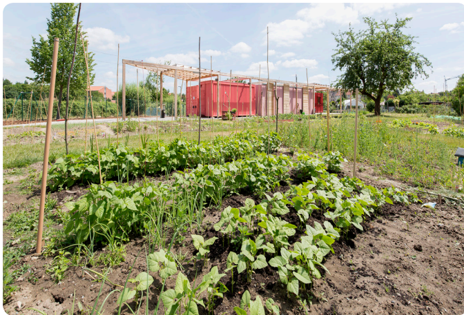
Garten ohne Grenzen

Vorhandene oder neu anzulegende Wege auf Teilen bereits aufgegebenen oder neben weiterhin in Betrieb befindlicher Gleise, eröffnen Gelegenheiten für einen Blick hinter die Kulissen der facettenreichen städtischen Struktur am Wilhelminischen Ring. Zugleich eröffnet es die Möglichkeit die Stadt abseits der vielbefahrenen Verkehrswege rad- und fußläufig zu erfahren und zu umrunden. Das „Ringgleis“ soll zu einem die Stadtstruktur Braunschweigs prägenden Markenzeichen entwickelt werden, dem sich Anlieger und Institutionen im Sinne einer neuen „Adresse“ öffnen und mit dem sie sich identifizieren können. Die