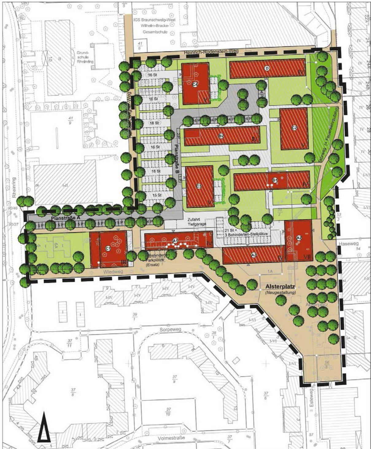
Nutzungsbeispiel Alsterplatz, nicht rechtsverbindlich