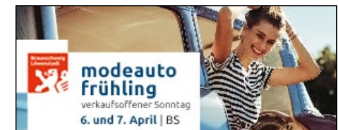
Banner 300 x 120 px