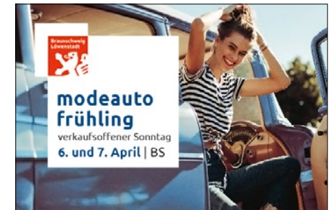
Banner 500 x 332 px