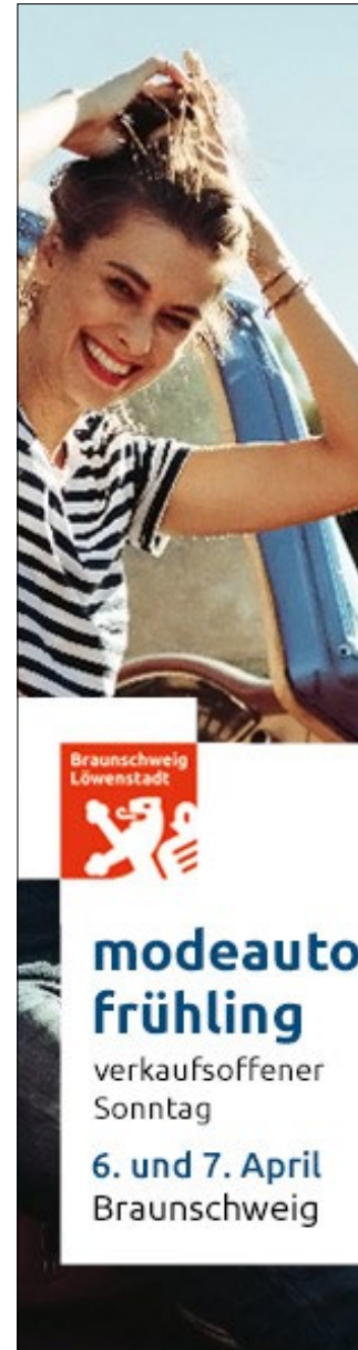
Banner 160 x 600 px