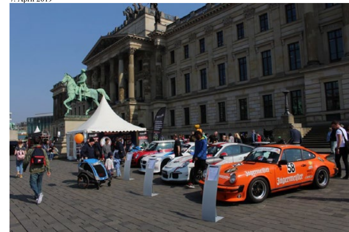
Auch Freunde des Motorsports bekamen einiges zu sehen.

Braunschweig. Strahlender Sonnenschein und frühlingshafte warme Temperaturen sorgten für gute Laune bei den Besucherinnen und Besuchern des diesjährigen modeautofrühling in der Braunschweiger Innenstadt. Die Löwenstadt startete mit aktuellen Automodellen, liebevoll gepflegten Oldtimern, abwechslungsreichen Modenschauen und einem unterhaltsamen Programm in die Frühlingssaison. Das teilt die Braunschweig Stadtmarketing GmbH mit.