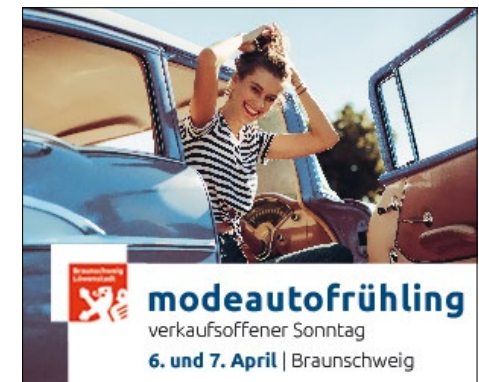
Banner 300 x 250 px