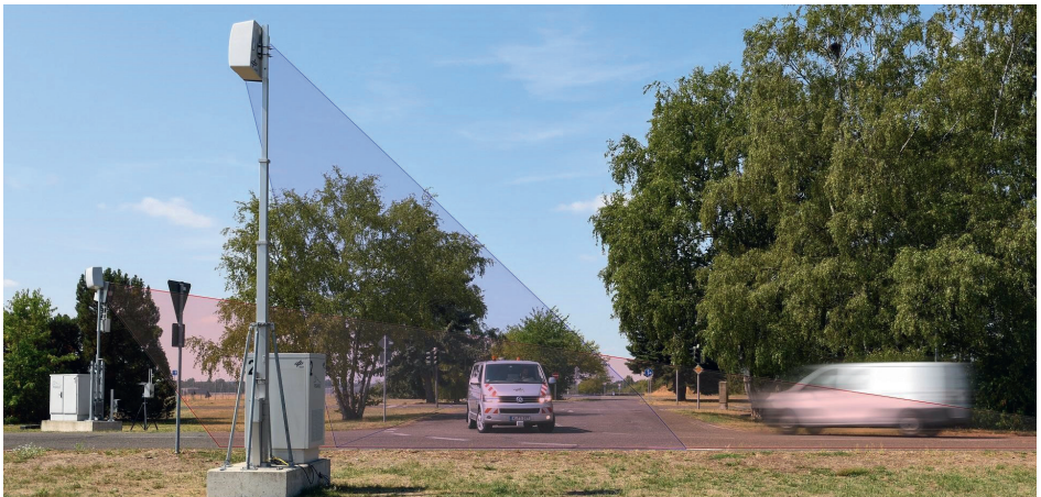
Mobile Messstationen

Zur Erfassung motorisierter wie nicht-motorisierter Verkehrsteilnehmer an wechselnden Standorten setzt das DLR mobile Messstationen mit hochpräziser Sensorik ein. Die Technik kann flexibel innerhalb des Testfeldes Niedersachsen sowie an projektspezifischen Einsatzorten eingesetzt werden und bietet wichtige Erkenntnisse zur Erprobung von Fahrassistenten und Verkehrsmanagementverfahren.