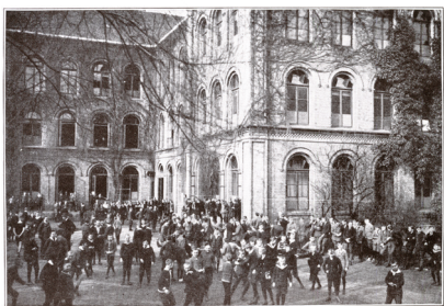
Dauze auf dem Schulhof