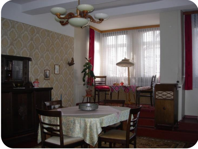
Foto: EMMA - Museumswohnung im Kavalierhaus