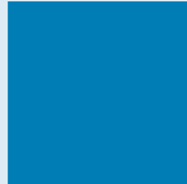
N. N. Telefon 470-8216 Zimmer 1.12