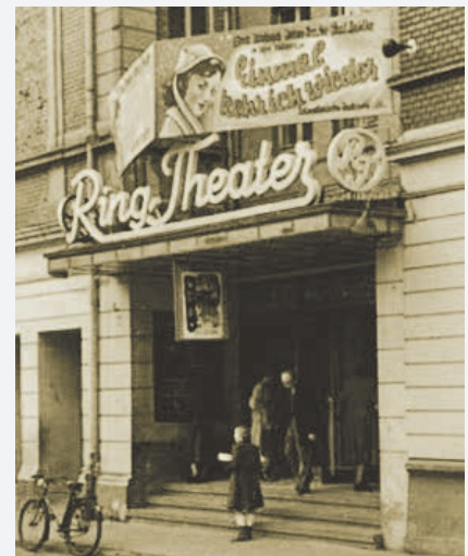
Abb. Eingang des bis Ende der 1960er-Jahre