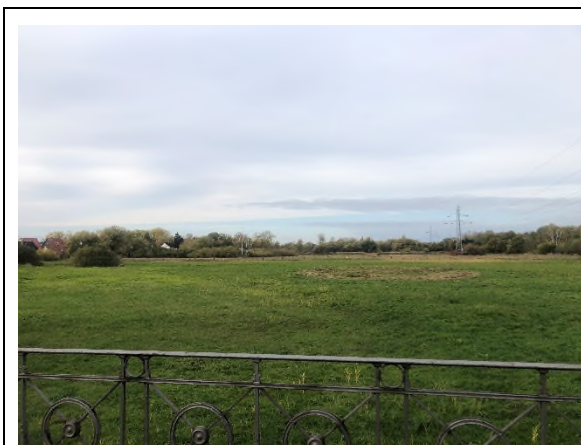
03) Bereich Bevenroder Straße – Blickrichtung Westen