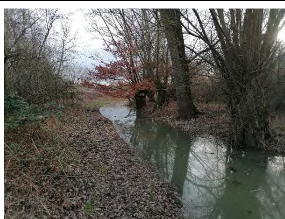
06) Bereich Ottenroder Straße – Blickrichtung Südosten