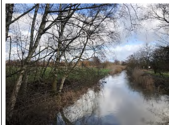
04) Bereich Feuerbergweg Brücke – Blickrichtung Nordosten