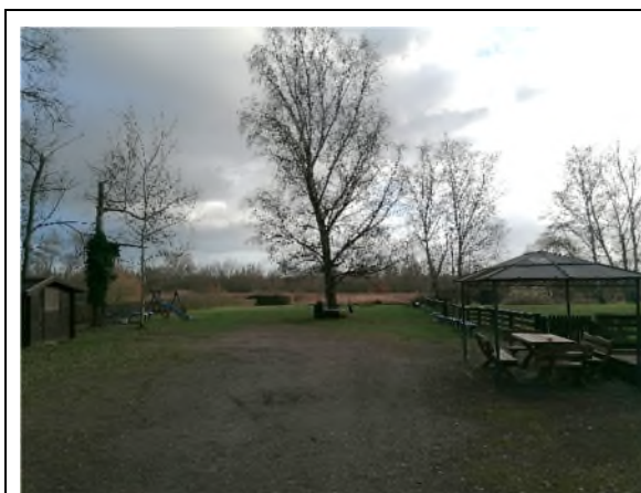
01) Bereich Hondelager Weg – Blickrichtung Süden