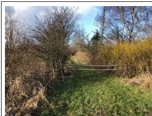
03) Bereich Feuerbergweg – Blickrichtung Norden