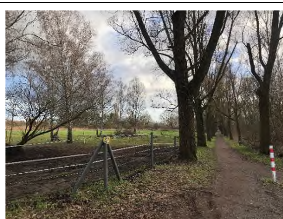
06) Bereich Bevebroder Straße – Blickrichtung Süden