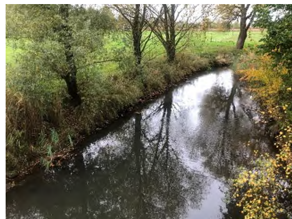
04) Bereich Feuerbergweg Brücke – Blickrichtung Südwesten