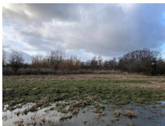
02) Bereich Feuerbergweg – Blickrichtung Nordwesten