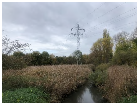
03) Bereich Brücke Wöhrderweg – Blickrichtung Nordwesten