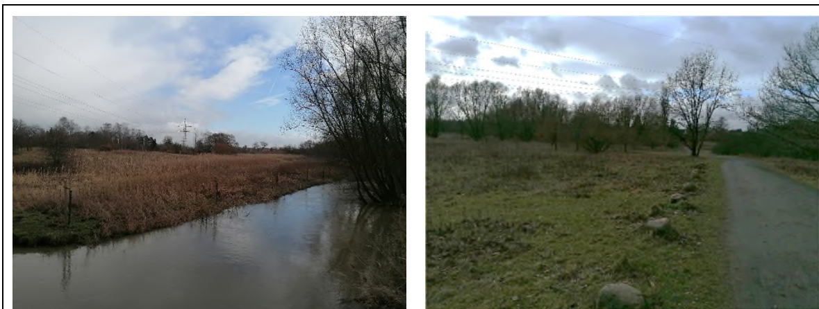
01) Bereich WabeMündung – Blickrichtung Nordosten