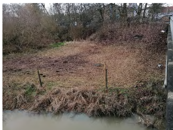
08) Bereich Brücke Bienroder Weg – Blickrichtung Süden