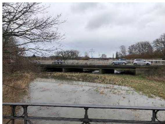
03) Bereich Bevenroder Straße – Blickrichtung Osten