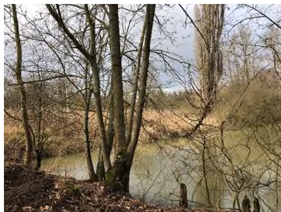
03) Bereich ehemaliges Germaniabad – Blickrichtung Westen