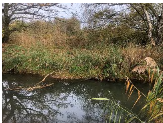
07) Bereich Steinhorstwiese – Blickrichtung Norden