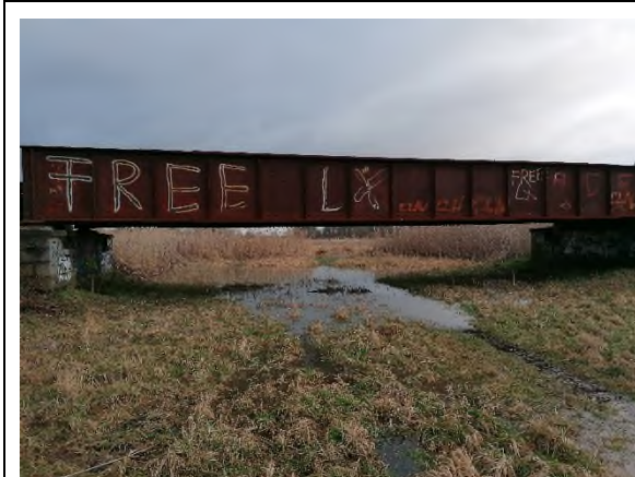
05) Bereich Bahnbrücke – Blickrichtung Osten