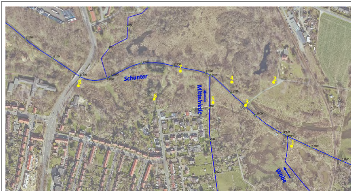
Standorte der Fotos