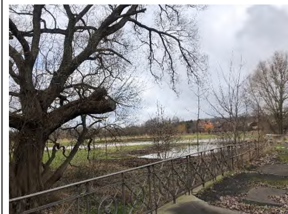
04) Bereich Bevenroder Straße Brücke – Blickrichtung Nordosten