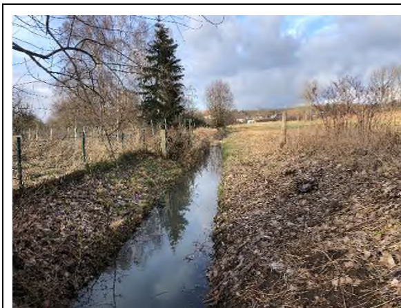
01) Bereich Feuerbergweg – Blickrichtung Norden