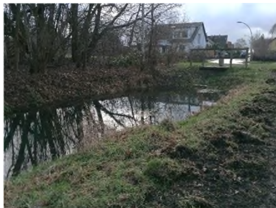
06) Bereich Steinhorstwiese Pumpwerk – Blickrichtung Süden