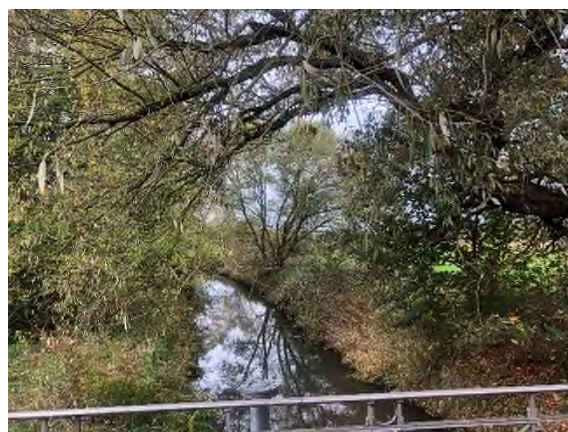
04) Bereich Bahnbrücke – Blickrichtung Osten