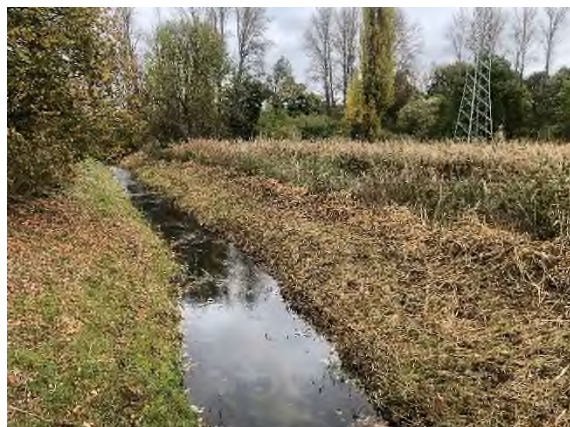
05) Bereich Mittelriede Mündung – Blickrichtung Nordosten