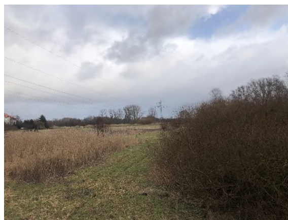
02) Bereich Bevenroder Straße – Blickrichtung Osten