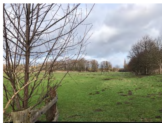
05) Bereich Feuerbergweg Graben 1 – Blickrichtung Nordosten